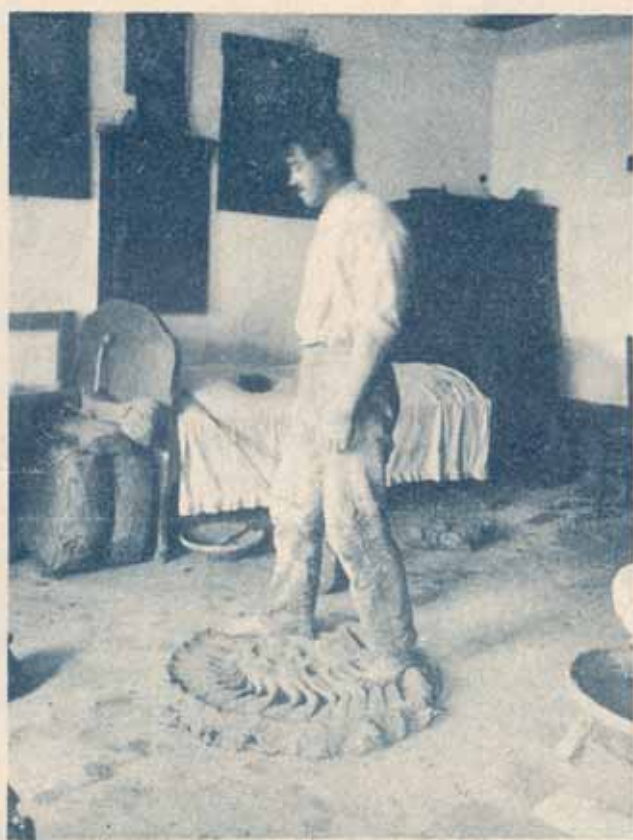
Lončar tepta glino da postane mehka in gnetljiva za oblikovanje raznih izdelkov.