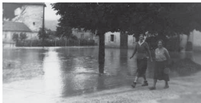
Poplavljen Ribnica v centru pred Miklovo hišo, na današnjem parkirišču. V ozadju mogočni Ribniški grad.