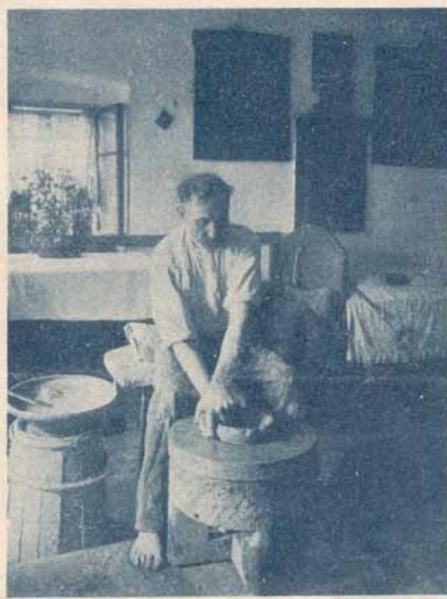
„Stegovanje“ lonca iz kepe gline na kolovratu, ki ga goni lončar z levo nogo.