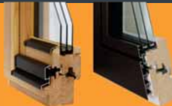
lesena okna INO-80

Z Inles-ovimi nizkoenergijskimi izdelki, so zimski in poletni dnevi veliko bolj prijetni.