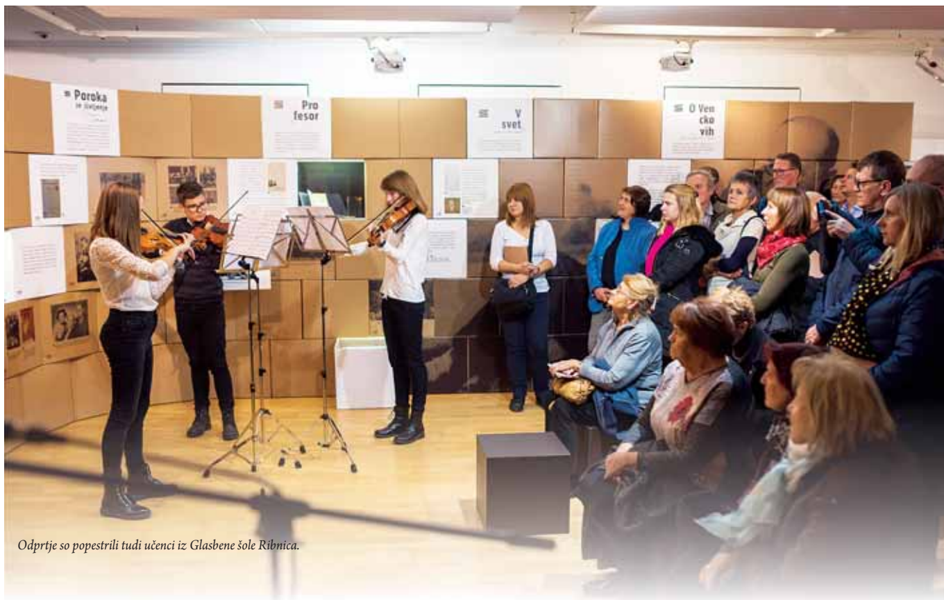
Odprtje so popestrili tudi učenci iz Glasbene šole Ribnica.