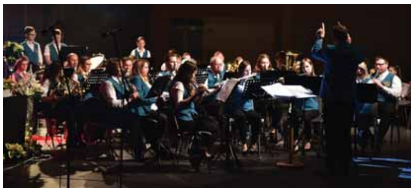
Ribniški pihalni orkester

Na podlagi 50. in 60. člena Zakona o prostorskem načrtovanju (ZPNačrt) (Uradni list RS, št. 33/07, 70/08 – ZVO-1B, 108/09, 80/10 – ZUPUDPP, 43/11 – ZKZ-C, 57/12, 57/12 – ZUPUDPP-A, 109/12, 35/13 – skl. US, 76/14 – odl. US, 14/15 – ZUUJFO in 61/17 – ZUreP-2) župan Občine Ribnica s tem