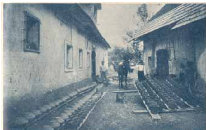
Prvo sušenje izdelane posode na sohnju Zadaj je videti z lonci otovorjenega konja, s kakršnimi so lončarji časih krošnjariji po deželi.

z lesenim batom v štirioglat »hleb«, ki so ga na stojalu oziroma »kobili« s srpom rezali na tenke kosce in iz njih odstranili razne primese. Očiščeno glino so zmočili z vodo in pustili ležati en dan, da se je glina dobro namočila. Namočeno glino je lončar zmetal na večji kup sredi sobe in jo začel tlačiti z nogami (»kolač«), da se je zmeščala in pregnetla. Pri tem delu so sodelovali vsi družinski člani, hlapci in dekle. Tako pripravljeno glino je lončar v večjih kepah vzel na svoj kolovrat in začel z izdelovanjem posode. Posodo je izdeloval na lesenem lončarskem kolovratu, imenovanem »kolurat«, ki ga je poganjal z levo nogo. Ob kolovratu je imel postavljeno še skledo z vodo, v kateri je bila namočena ovčja ali jelenova koža ali »blek«, modelirko ali »špriklo« in lončke z raztopljeno ilovico, ki jo je uporabljal za krašenje posode, ter tanko žico ali »struno«, s katero je lonec odrezal s kolovrata.