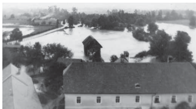
Poplava za starim župnjiščem v Ribnici, ki je bilo tudi bombardirano koncem 2. svetovne vojne. Na poplavljenih površinah za župnjiščem danes stoji ta trgovini Hofer in DM