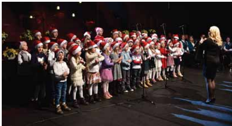
Zborček POŠ Dolenja vas in POŠ Sušje