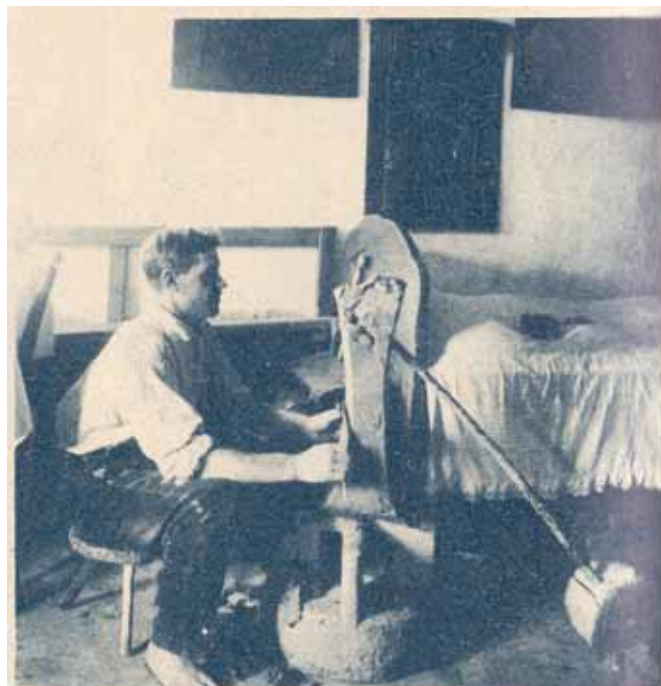
Lončar reže glino da odstrani iz nje vse primesi in da postane popolnoma čista.

Glino so pred uporabo temeljito očistili. Še v sedemdesetih letih dvajsetega stoletja so jo sredi glavnega bivalnega prostora – »hiše« – stolkli