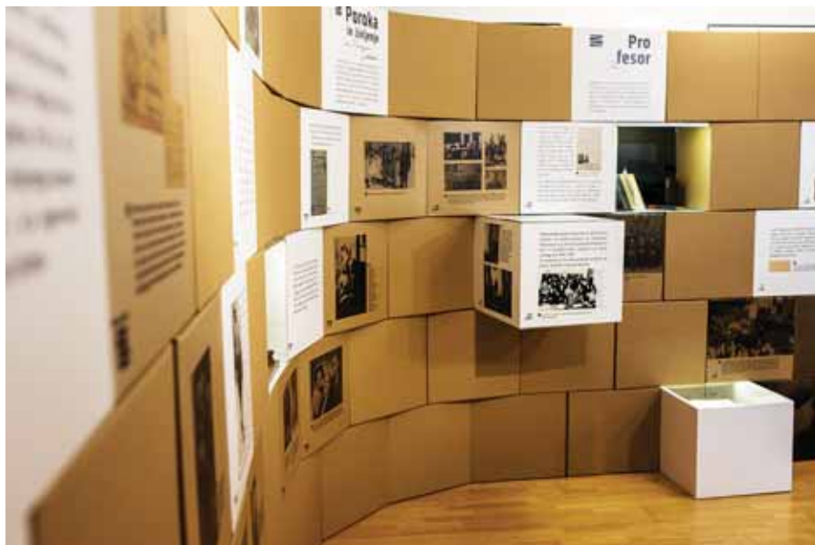
Utrinek z razstave.